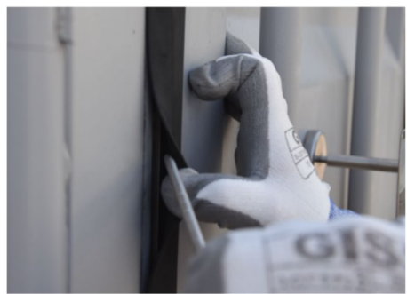
Photo 1. Ecartement du joint extérieur

Écartez le joint extérieur (cf. photo 1) et faites glisser la sonde par un léger mouvement de rotation afin de l'aligner dans le plan de jonction des deux portes. Puis, par des mouvements de rotation et de poussée, glissez la sonde entre la porte gauche et le joint intérieur (cf. photo 2).