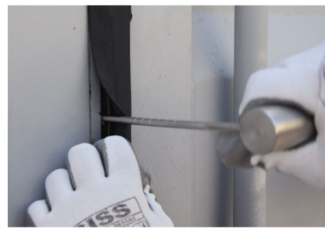
Photo 2. Glissement du joint entre la porte et le joint extérieur