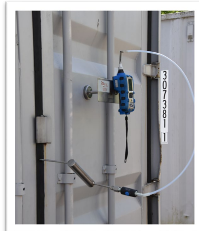
Photo 4. Utilisation de supports aimantés pour le maintien des appareils de mesure.