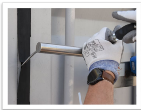
Photo 3. Connexion de la pompe.