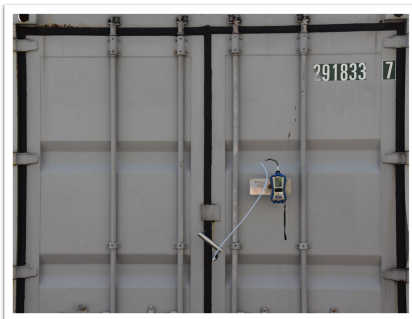
Photo 5. Réalisation de la mesure grâce à l'appareil de détection.

Procédez à la mesure via l'appareil de détection (cf. photo 5) choisi au bout d'une minute minimum après le début de la mise en route de la pompe de prélèvement. Il s'agit de s'assurer que l'air contenu dans le conteneur parvienne bien jusqu'à l'appareil de mesure. L'opération peut être renouvelée plusieurs fois si différents détecteurs ou analyseurs doivent être utilisés pour qualifier l'atmosphère du conteneur maritime.