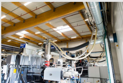
Fabrication d'objets en matière plastique