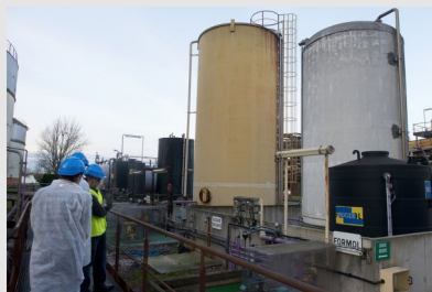
Traitement biocide lors de la fabrication du sucre