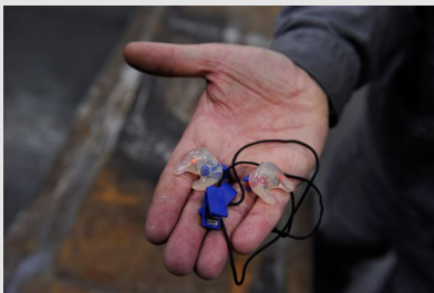
© Patrick Delapierre / INRS Bouchons antibruit