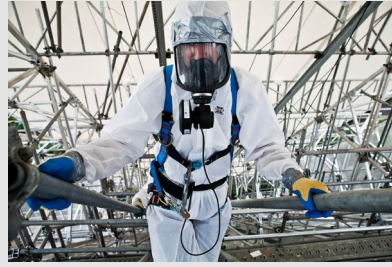
Combinaison de protection jetable, masque à ventilation assistée et harnais