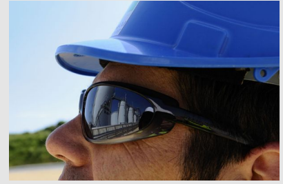
Casque et lunettes de protection