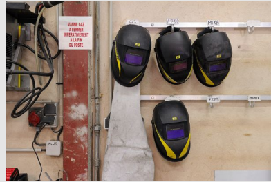
Masques et tablier de soudage