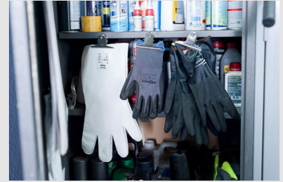
Gants de protection