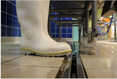
Bottes antidérapantes