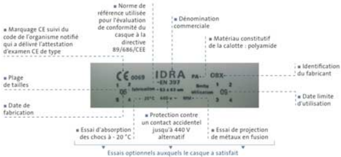
Exemple de marquage de casque