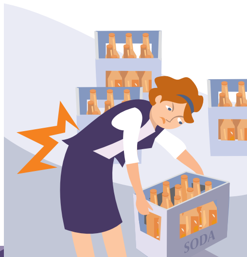
DOULEURS AU DOS