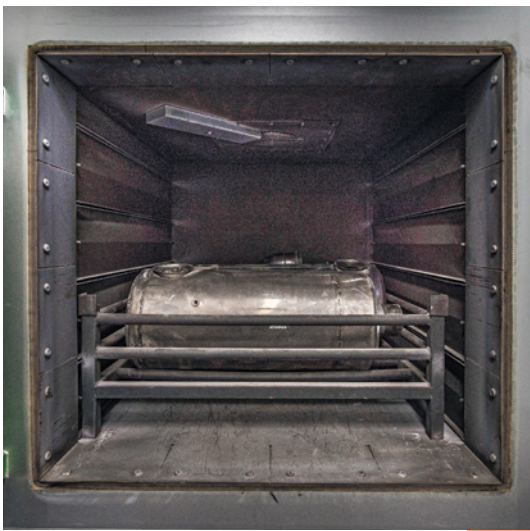
■ FAP dans un four

Une exposition de l'opérateur peut néanmoins se produire lors du chargement ou du déchargement du four. Il est donc recommandé de placer au-dessus de sa porte une hotte qui permettra de capter les fumées s'échappant lors de son ouverture. Une telle hotte devra être placée aussi près que possible au-dessus de la porte sans toutefois gêner l'accès au four. Pour être efficace, elle devra avoir une dimension et un débit d'aspiration suffisants pour capter l'ensemble du panache thermique.