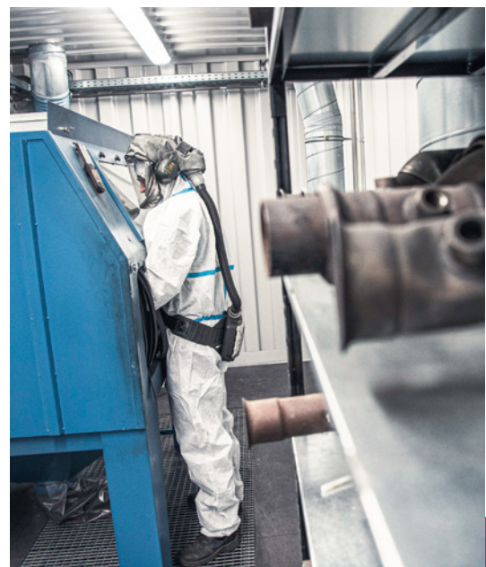
■ Opération de nettoyage par soufflage dans une boîte à gants

Le port de certains équipements de protection individuelle (EPI) est également nécessaire ( voir chapitre 3.4 ).