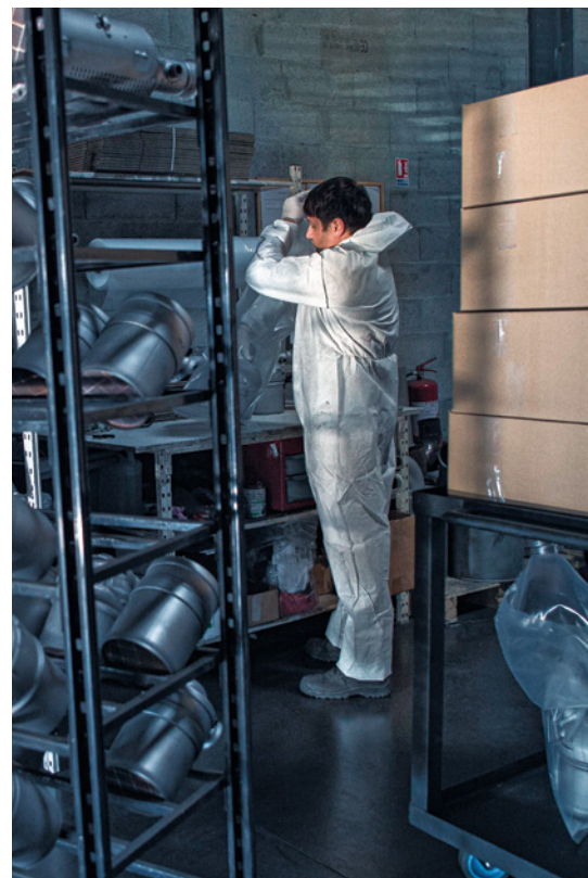
■ Emballage de FAP et de catalyseurs nettoyés avant expédition

Ces opérations peuvent néanmoins conduire à des expositions par contact cutané, il est donc nécessaire de porter des équipements de protection individuelle adaptés (voir chapitre 3.4).