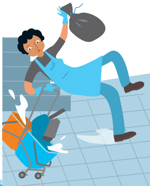
CHUTES ET GLISSADES