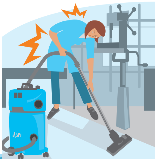
DOULEURS AU DOS ET AUX ARTICULATIONS