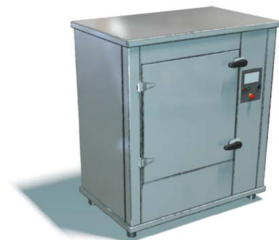
a) Enceinte fermée