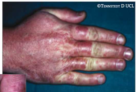
Dermatite de contact aux protéines chez un vétérinaire allergique au liquide amniotique de vaches lors de césariennes (prick tests positifs).

les 9 cas. Le tableau clinique et le bilan allergologique font poser le diagnostic de dermatite de contact aux protéines.