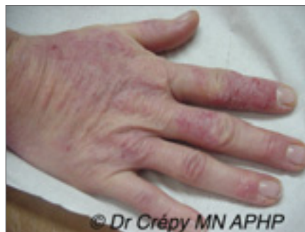
Dermatite de contact allergique au glutaraldéhyde chez une assistante vétérinaire.

Dans la série rapportée par Valsecchi et al. des vétérinaires ayant une DAC, les tests épicutanés sont positifs et pertinents aux allergènes des désinfectants et détergents, principalement des