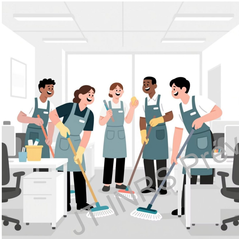
Illustration générée par l'IA

Dans un contexte de tension sur le marché du travail, la prévention des risques devient un argument différenciant majeur.