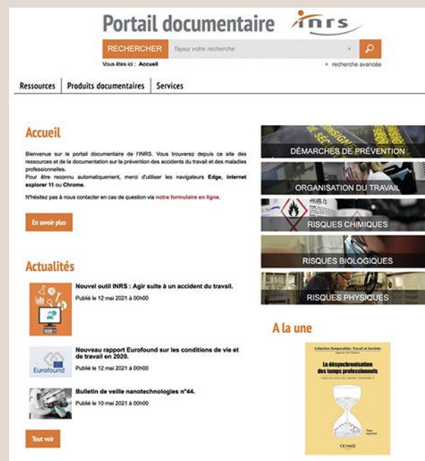
↑ FIGURE 1 Page d'accueil (capture d'écran).

Les informations sont accessibles dans un premier temps, via cinq thématiques principales présentées de manière illustrée en page d'accueil : fondamentaux de la prévention, organisation du travail, risques chimiques, risques mécaniques, risques biologiques. Ces pages proposent une sélection actualisée d'informations sur la thématique sélectionnée : veille, dossiers documentaires et actualités s'y reportant (Cf. Figure 1).