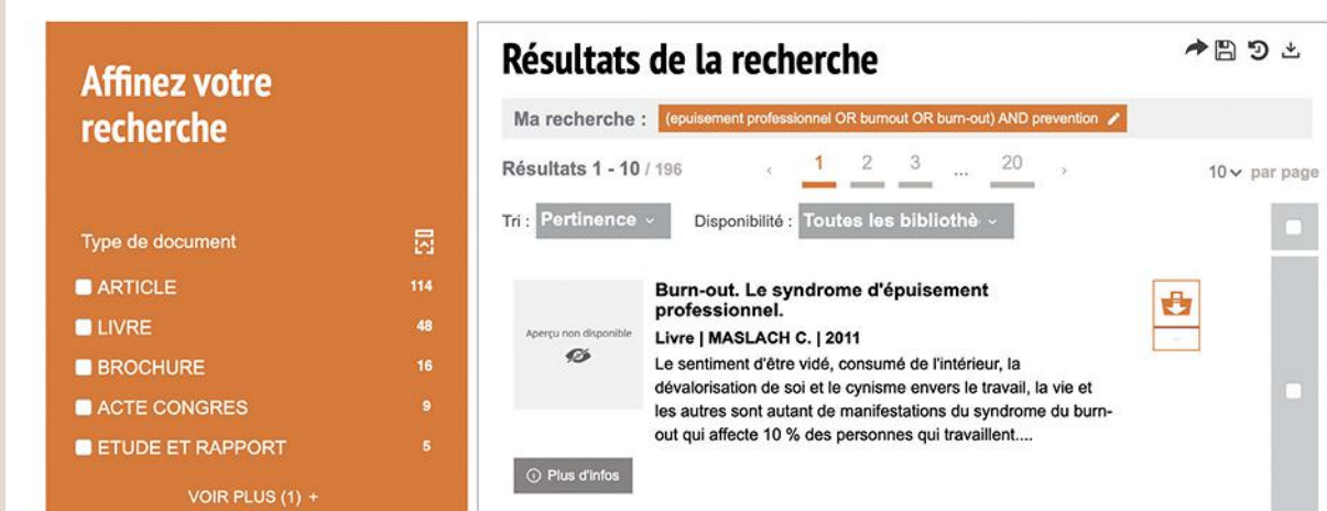
↑ FIGURE 2 Exemple de recherche (capture d'écran).