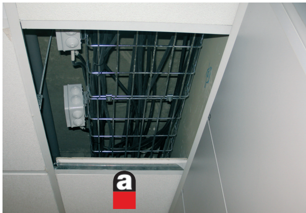
◀ Dans les faux plafonds