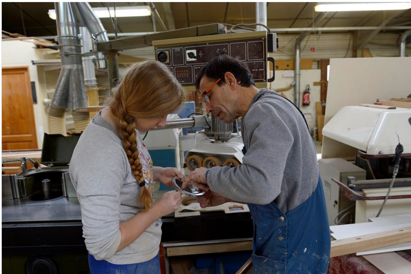
Une apprentie ébéniste et son tuteur

Pour exercer son rôle, le tuteur doit avoir les compétences en santé et sécurité au travail, disposer du temps nécessaire et des outils adaptés.