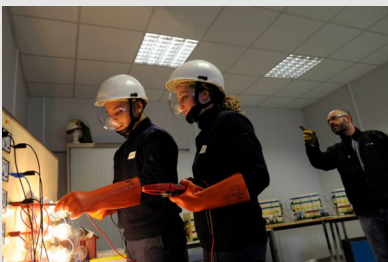
Formation d'apprentis au risque électrique