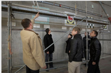
© Georges Bartoli pour l'INRS - 2013 Journée consacrée à la prévention dans un CFA