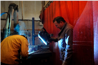
Formation à la soudure d'un nouvel embauché