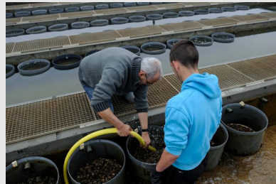
Accueil d'un nouvel embauché dans une entreprise ostréicole