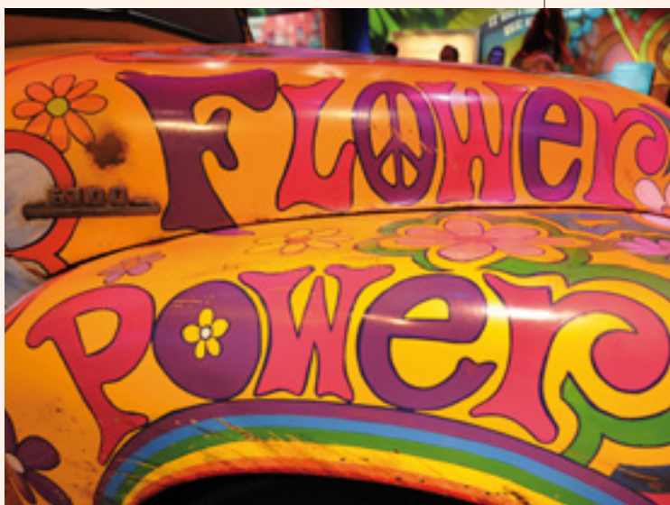
Détail d'un « Magic Bus » hippie, exposé au Bethel Woods Center for the Arts, un musée construit sur le site du festival de musique Woodstock 1969 et qui lui est consacré.

Les années 80 ne présentent, mis à part une forte croissance des personnes usant de substances, qu'une seule nouveauté : l'augmentation de la consommation de la cocaïne qui semble pendant un temps devancer l'usage d'héroïne. Un autre facteur de l'évolution des consommations et de la diminution de l'héroïne, est, selon Pascal Courty, la situation économique des ménages qui va considérablement se détériorer au cours des années 80 tandis que les substances sont dotées d'une très forte rigidité des prix (prix moyen de l'héroïne à 1 000 francs le gramme = dose journalière moyenne). L'alcool commence à être utilisé au début des années 80 comme « substitut » aux autres