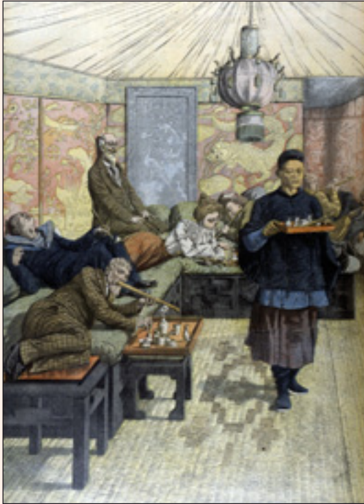
Fumerie d'opium en France. « Le Petit Journal », juillet 1903.

L'usage de drogues, définies comme étant des « substances pouvant altérer les états de conscience de l'homme », est retrouvé très tôt dans l'histoire des civilisations humaines.