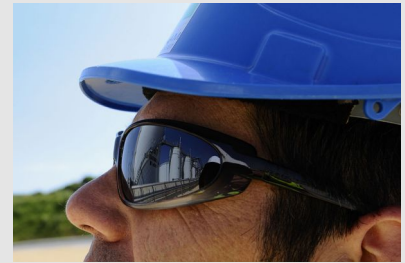
Casque et lunettes de protection