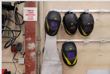
Masques et tablier de soudage