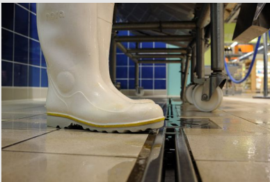
Bottes antidérapantes