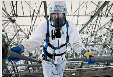
Combinaison de protection jetable, masque à ventilation assistée et harnais