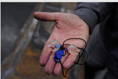
© Patrick Delapierre / INRS Bouchons antibruit