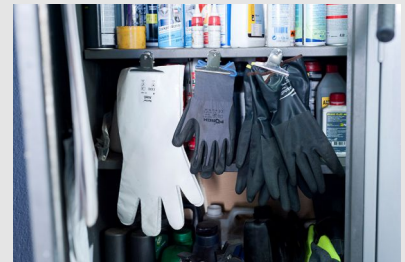
Gants de protection