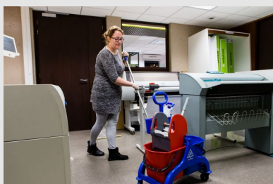
Utilisation de produits contenant des désinfectants biocides