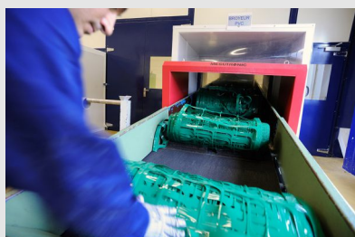
Fabrication de matières plastiques souples