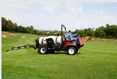
Epannage de produits phytosanitaires