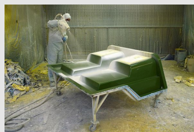
Utilisation de produits contenant des solvants (peintures, vernis, colles)

L'exposition professionnelle aux perturbateurs endocriniens concerne de nombreuses activités professionnelles (voir le tableau ci-dessous) :