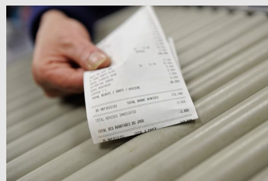
Manipulation de papiers thermiques (tickets de caisse)