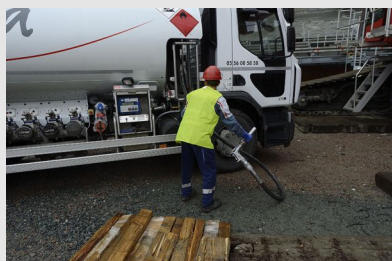
Distribution de carburant