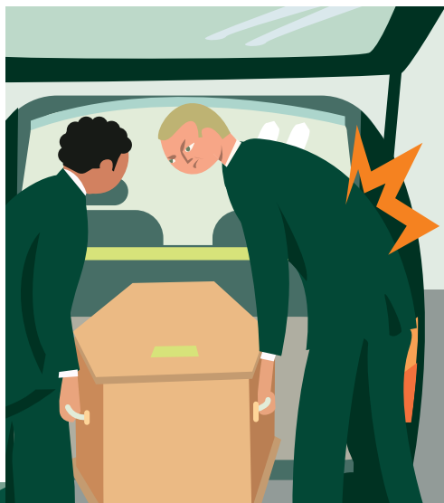
DOULEURS AU DOS ET AUX ARTICULATIONS