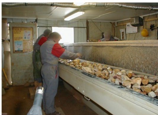
Avant traitement : les galets rejetés sont lâchés entre les deux tapis