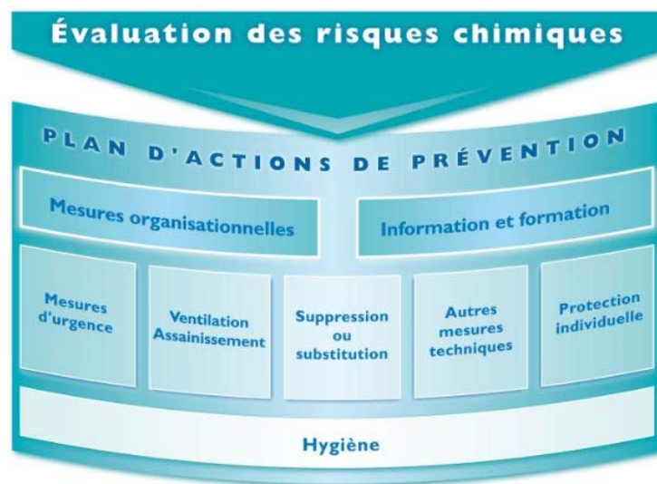
Figure 1: Conduite d'un plan d'actions de prévention du risque chimique

Quand ni la suppression ni la substitution ne sont réalisables, un ensemble d'actions doit permettre de réduire le plus possible le niveau du risque, les quantités de produits dangereux, le nombre de salariés exposés ou encore la fréquence ou la durée des expositions. Ces mesures peuvent être d'ordre organisationnel ou technique.