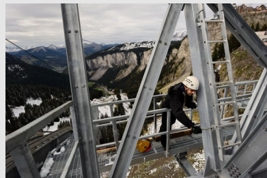
Travail en altitude (Ici chantier de construction d'un téléphérique en montagne)