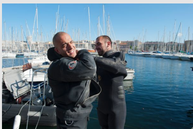
Plongeurs professionnels se préparant à intervenir