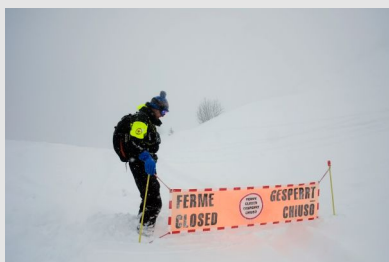
Pisteur secouriste en haute montagne