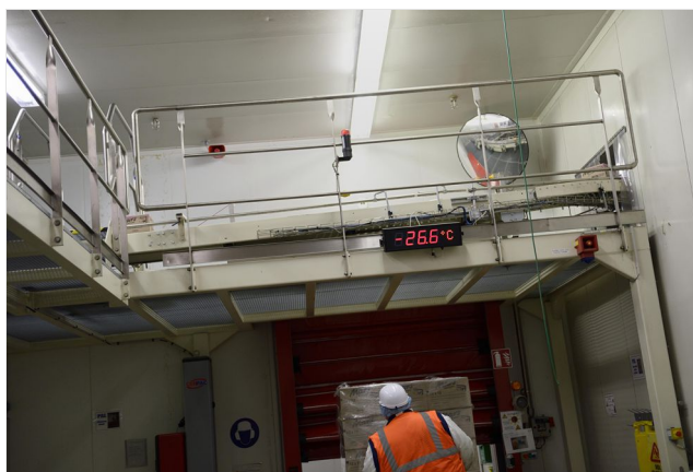
Affichage de la température ambiante dans une chambre froide

Pour les travaux à l'intérieur de locaux, en installations frigorifiques par exemple, il convient de relever les températures à l'intérieur des installations. Celles-ci doivent être équipées d'instruments de suivi. Pour les travaux en extérieur, il est nécessaire de surveiller régulièrement les fluctuations de température.