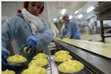
Chaîne de fabrication réfrigérée dans l'industrie agroalimentaire