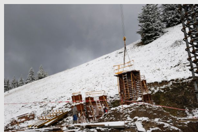
Chantier de BTP en hiver