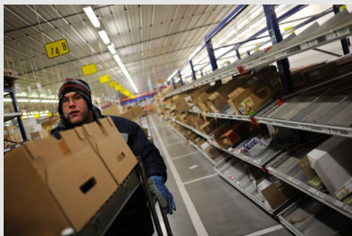
Travail en entrepôt frigorifique